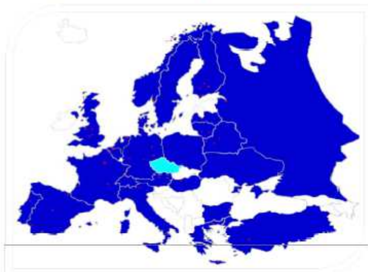
Obr. 4: Spolupracující evropské univerzity